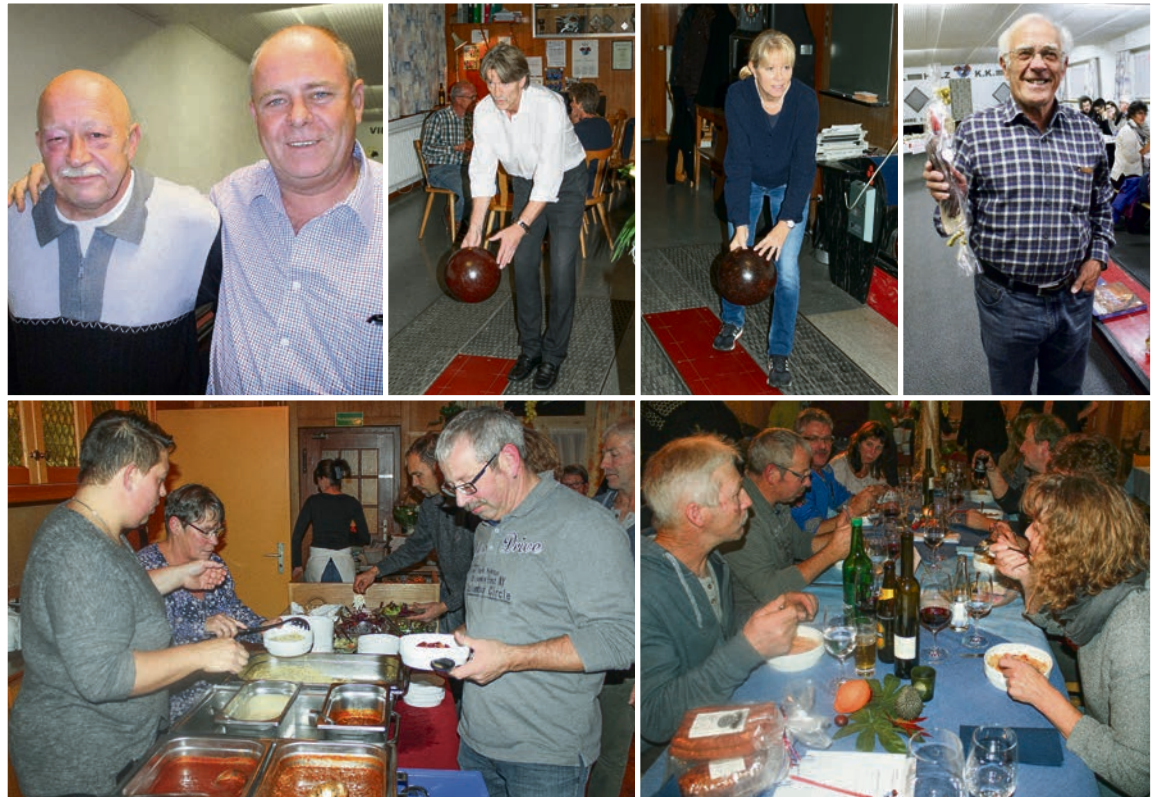
Impressionen vom Dorfkegelturnier.

Mitmachen kommt vor dem Rang Anlässe und Feste, aber auch andere Veranstaltungen finden